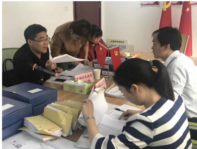
图：民政管理系教师在开福区社会组织孵化基地开展业务评估服务工作

评估组教师科学合理制定了评估指标体系，主要围绕社会组织机构的基础条件、内部治理、工作绩效、社会评价等四个方面，通过查看材料、实地探访、座谈交流等方式全面了解各项工作的落实情况，并有针对性地对社会组织各项工作发展提出了具体的意见与建议。最后结合具体的评估指标赋予相应的分数，评估出开福区级社会组织3A、4A、5A等相应的等级。