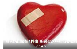
医护人员自拍4件事 防感染... (部分文字被遮挡)