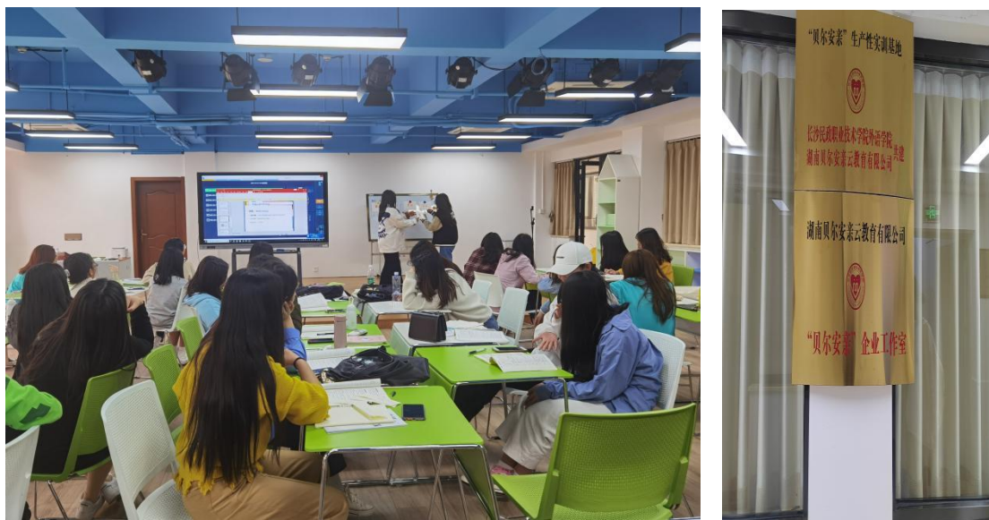
图 5 学生在实训室实训