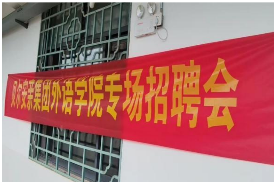
图 4 2024 届学生现场招聘会