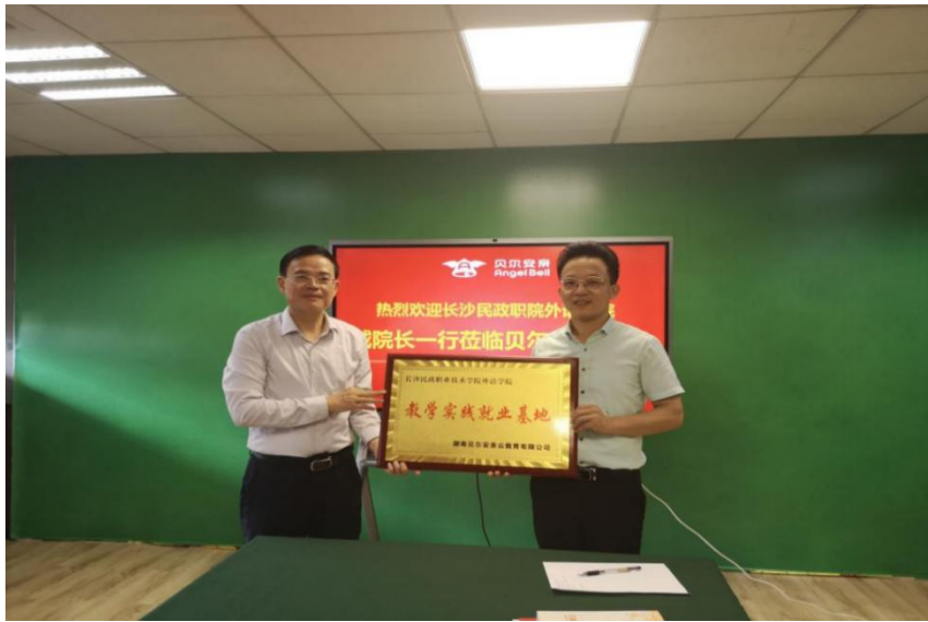
图 1 校企合作授牌仪式