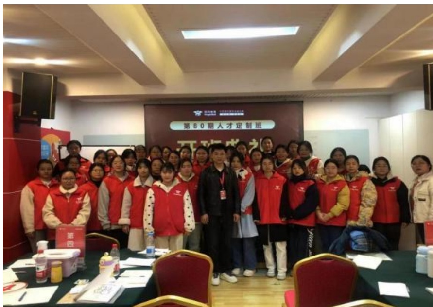
图 3 2024 届学生岗前培训