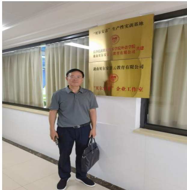
图 2 生产性实训基地与企业工作室授牌

湖南贝尔安亲云教育有限公司的资源投入主要包括基地建设投入、科研投入、培训投入与资源投入。目前已与长沙民政职业技术学院外语学院建立了“贝尔安亲”生产性实训基地、“贝尔安亲”企业工作室、产业导师工作室。