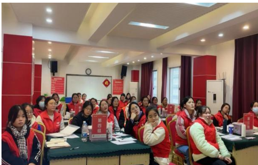
图 7 2024 届学生岗前培训研讨