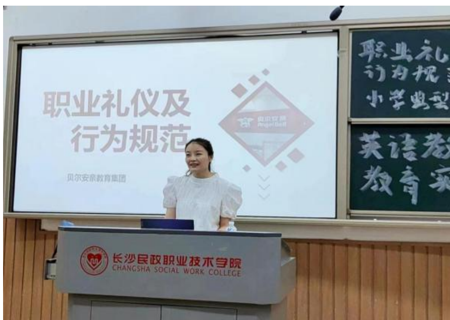
图 8 2024 届学生培训周讲座