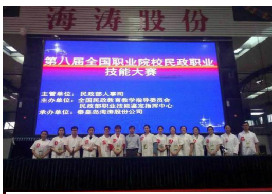
图 4-9 学生在比赛现场

(2) 竞赛成绩优异：2018年6月4日7日，由全国民政职业教育教学指导委员会、民政部职业技能鉴定指导中心主办，秦皇岛海涛股份公司承办的第八届全国职业院校民政职业技能大赛殡仪服务员、遗体防腐整容师、遗体火化师、公墓管理员四个职业的决赛在河北省秦皇岛市成功举办。全国各院校80名选手，我校殡仪学院派出24名选手，经理论网络考试、实操笔答、现场实际操作考核和职业能力展示视频四个模块的竞技角逐，我校选手获得一等奖3个、二等奖8个、三等奖12个。2018年8月在2018年“挑战杯——彩虹人生”全国职业学校