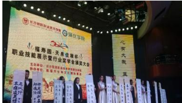
3-2 殡仪学院奖学金颁奖大会

奖学金支持： 2018年，福寿园国际集团、台湾龙岩集团、泰康同泰善寿投资管理有限公司、天津永安公墓、北京天泉佳境陵园建筑设计有限公司等18家行业企业单位特别设立了学生奖学金，奖金总额50万元，为200多名殡葬学子送去了最真挚的祝福，让学生感受到行业企业对他们的关爱，也让殡仪学子更多的了解行业企业，同时也解决了殡葬教育过程中的一些难题。