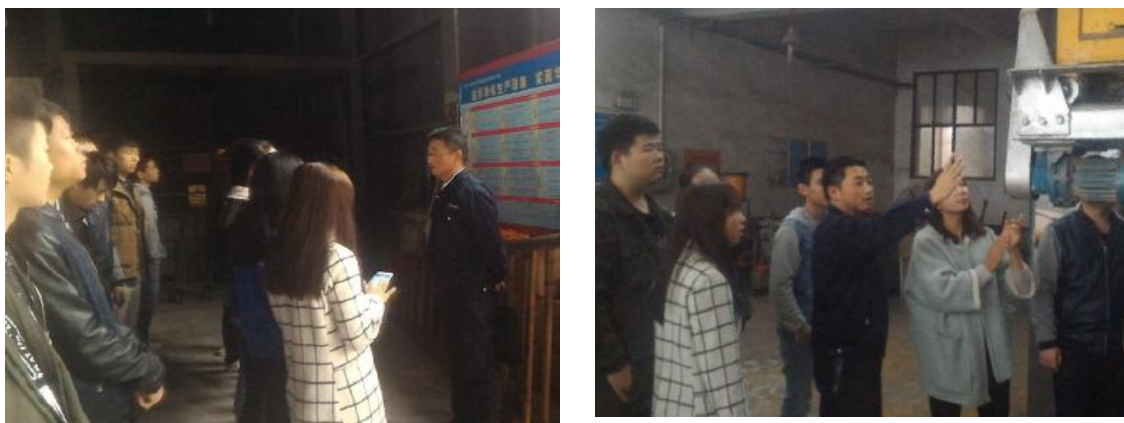
图 3-7 学生在企业上课

学生课堂进企业: 通过学院防腐设备教研室与华望科技股份有限公司共同研究确定课程安排,实行理论教学与定岗实训相结合,学校老师与企业专家双师资教学的方式。将上课学生分为两组,一组进入普通卫生棺,一组分到高档卫生棺,然后进行实训学习岗位互换,其间穿插理论知识回顾,学习过程中针对学生存在的疑惑及时分析讲授。每天课程分为早课内容安排、车间实训实践学习与讲解、晚课学习内容总结回顾及实训课程企业老师总结。