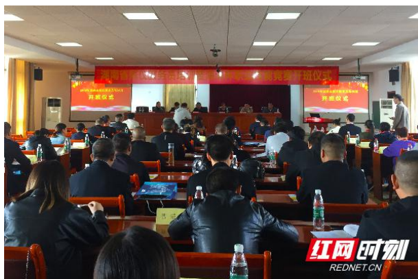
图 3-3 开班仪式

校企合作研发： 10月16日，湖南省殡仪服务员培训班暨湖南省殡仪服务员职业技能竞赛在长沙民政职业技术学院开班。来自全省14个市州的50余名殡仪服务一线员工参加培训。省民政厅党组副书记、副厅长邓磊出席培训班并讲话。此次培训由湖南省殡葬协会承办，长沙民政职业技术学院、长沙市殡葬事业管理处协办。培训为期4天，第一阶段是业务培训，培训内容包括殡仪服务专业理论、殡仪服务员专业实操、殡葬政策法规解读等；第二阶段是技能竞赛，分为理论知识考试和实际操作技能考核。湖南省民政厅将根据全省竞赛情况，择优选拔人员参加11月初举办的全国殡仪服务员职业技能竞赛。