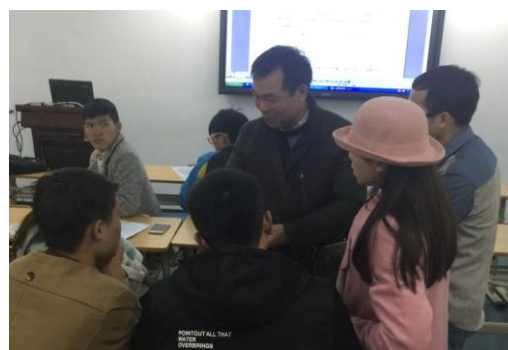
图 3-6 企业专家在上课