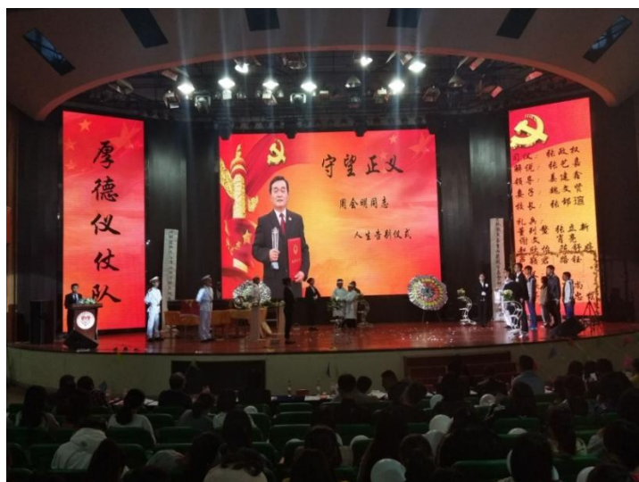
图 4-3 学生职业技能竞赛

2018年11月，学院举办了《2018年“福寿园·天泉佳境”杯职业技能大赛》，大赛以全国模范检察官、安徽省宣城市检察院副检察长周会明同志为主题，以礼仪、整形、书法、墓碑设计、视频制作五大职业技能为依托，以学习贯彻习近平新时代中国特色社会主义思想 and 党的十九大精神为内核，以赛促学，将思想教育融入技能大赛。本届技能大赛有13个班级、8个协会参与，参赛学生达到300余人，观赛师生达800余人。以大赛的举办为契机，让学院师生在备赛过程中自发通过网络平台学习周会明同志勤勉敬业的优秀事迹，在比赛过程中让学生们通过一场场个性化的仪式感染更多身边人，在比赛后通过新闻报道让楷模精神更广泛传播。打破了思想教育上“知识灌输”的传统模式，调动起了全院师生学习楷模的主动性，采用这种“轻灌输，重互动”的开放式教学模式激发学生学习兴趣，