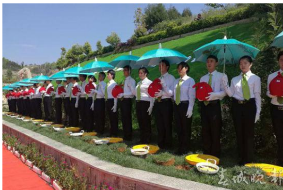
图 3-5 学生服务现场

企业服务： 从 2010 年开始，殡仪学院每年清明派 80 名学生与永安公墓一起开展免费生态环保葬，到 2018 年清明，共与永安公墓开展生态环保葬 58 场，已有 3591 位绿色殡葬践行者在永安落葬。除此之外，近几年殡仪学院还为湖南长沙、广东深圳、湖北荆门、河南许昌、武汉石门峰、武汉长乐园、云南石林、福建漳州、贵州贵阳、贵州毕节等地策划主持节地生态葬或公祭活动，推断