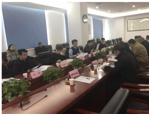
图 3-4 课题结题论证会

殡仪学院主动服务湖南省殡葬改革： 2018年8月初至11月底，主要由殡仪学院老师组成的课题组，为完成湖南省政府、民政厅下达的《湖南现代殡葬改革发展报告》课题，进行了扎实的调研与撰写工作。报告对于湖南殡葬改革的现状、存在的问题、产生的原因进行了详实地阐述，并在借鉴外省经验基础上，因地制宜提出了湖南