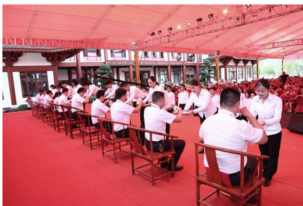
图 4-1 学徒制中的拜师仪式

括陵园绿化、园区接待服务、陵园人力资源、陵园产品设计在内的 4 次专题实践教学活 动。为了上好每一次课，学院卢军院长、李毓超主任等学院领导高度重视，从筛选企业专家，到确定授课日期，再到选择教学内容，逐项加以落实。在每次教学活动开展前，课程任课老师更是不敢懈怠，一方面与唐人万寿园的授课教师就教学内容的取舍、教学活动的组织、教学课件的制作等问题反复进行交流，另一方面从教学活动整体安排到每个教学知识点都要跟学生一一落实，布置好教学任务。教学活动采取课堂理论教学结合沙盘推演、园区实地讲解等方式，教学形式多样，理论与实践相结合，使学生对行业的发展趋势有了更加清晰的了解，对岗位技能有了更加系统的掌握。为了加强学习的效果，学生们还针对唐人万寿园的园区绿化养护与管理形成了调查报告与改造建议方案，并将学习成果直接反馈给企业，服务于企业的建设。