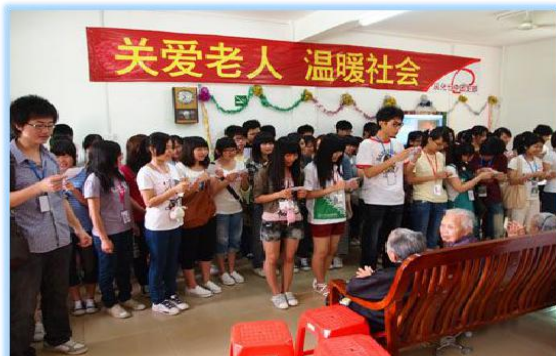
艺术学院青年志愿者服务艺术力量志愿者团队

“关爱老人，与爱同行”志愿服务活动、安全文明志愿者特色小分队志愿服务活动、学雷锋志愿服务活动、一对一学，帮扶留守儿童德馨园小学志愿活动、清除牛皮癣志愿服务活动、关心关爱重点关爱同学帮扶活动、“衣+衣”爱心捐赠活动、文明交通行志愿活动等。