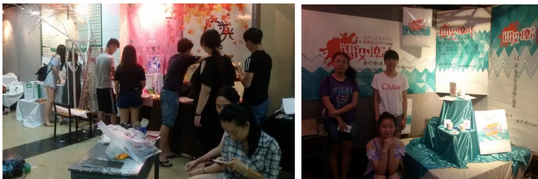
视传专业《项目整合设计》“课程汇报展”现场

同时，减少传统试卷考试的比重，逐步建立“专业教学课程汇报展”制度，从而充分调动学生的学习积极性。“专业教学课程汇报展”要求学生把学习成果进行专题讲解分析，并进行课程作业汇报展示，通过这些形式的考核，提高了学生的实践能力，使之更好的适应现代人才市场与岗位的需要。