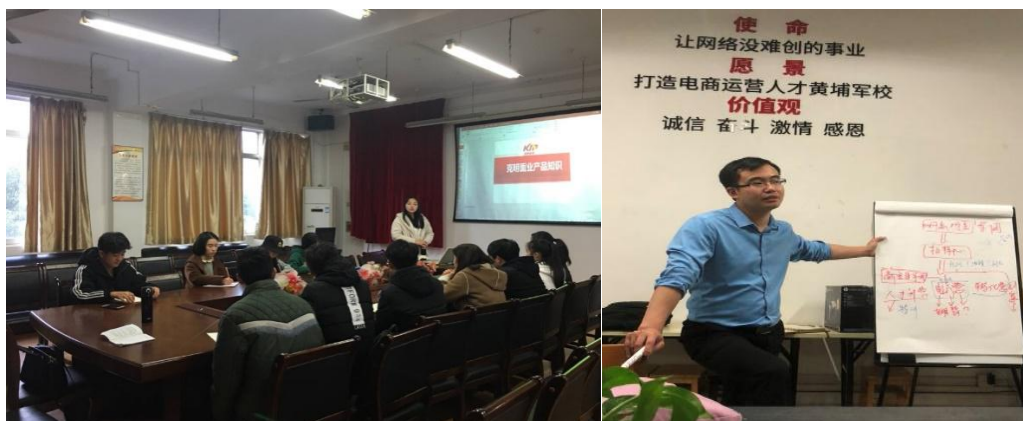
图 10：工作室一年级成员在校接受企业和学长的培训

大二，工作室的优秀成员进入“电商特训营”。暑假期间，特训营成员作为项目员工全职参加项目过程，快速积累经验。在训练营期间，共为企业店铺累积吸引粉丝 2 万 7 千人次，店铺访客数增长率 62.8%，浏览量增长率 49%，销售额同比增长 221%，销售额 30 万元，为企业创造直接经济效益 10 余万元。