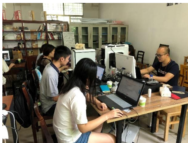
图 11：暑假特训营成员在校工作

大二，工作室的优秀成员进入“电商特训营”。暑假期间，特训营成员作为项目员工全职参加项目过程，快速积累经验。在训练营期间，共为企业店铺累积吸引粉丝 2 万 7 千人次，店铺访客数增长率 62.8%，浏览量增长率 49%，销售额同比增长 221%，销售额 30 万元，为企业创造直接经济效益 10 余万元。