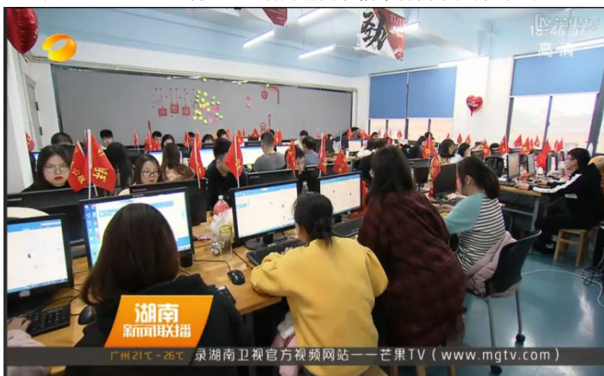
图 8：2018.11.11 晚 18:30 湖南新闻联播报道民政电商奋战森马电商双十一