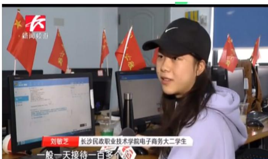
图 6：2018.11.10 晚 20:00 长沙新闻频道报道民政电商备战森马电商双十一

借助企业双十一的短期用工高峰期，依托企业的真实岗位，结合专业的课程实训，通过校企合作把电商“搬”进校园，创新人才培养新模式，真正实现专业与产业的对接、课程内容与职业标准的对接、教学过程与工作流程的对接，使人才培养真正符合社会实际需求，也进一步提高学生对岗位的认知和实操能力，展现优秀的职业素养和敬业的工匠精神，有效提升学校和社会的专业影响力。