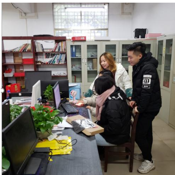
图 12：高年级学生指导工作室新晋成员完成工作

目前“阿创模式”已经形成了从“工作室”到“特训营”再到成为企业项目合伙人，反哺工作室的人才培养闭环的模式。累积为企业创造销售额超过百万，培养学生 56 名，合作项目已经初见成效。