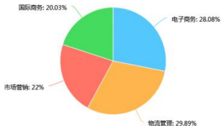
图1 新生专业分布百分表

我院继续在 2018 级新生班级推行“双导师”制度，聘请 15 位企业高管或骨干担任企业导师。