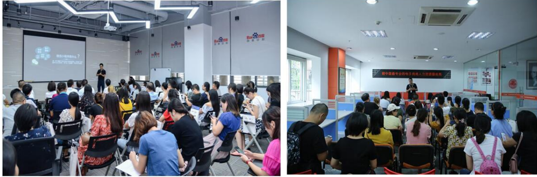
图 14 暑期国培项目参培学员深入百度创新中心调研交流