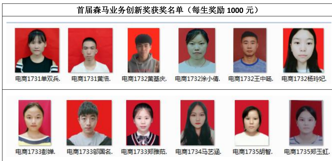
图5 首届森马业务创新奖获奖学生

根据2018年电商双十一实训综合业绩和专家评分，长沙民政商学院联合森马电商企业评选了首届森马业务创新奖、C位优等生、客服牛人、服务明星、优秀客服等众多奖项，获奖名单如下：