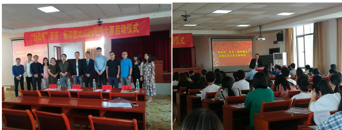
图 9 新印杯京东店铺运营大赛学生团队获奖名单

“新印杯”京东·新印图文店铺运营大赛开启了产教融合的新模式，对资源、平台与机制等要素进行了系统化融合，形成教育链、人才链、创新链和产业链的贯通融合，完成了校企合作从“融入”到“融合”的过程。